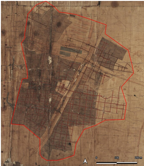
Braunkohlenwerk Altengroitzsch Liebert & Genossen (Kartengrundlage: Grubenriss: SächsBergAFG 40038-1 Neusign: B16634, 1876.)