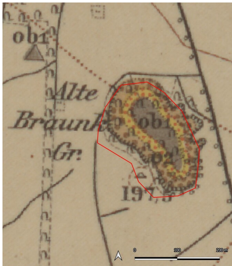
Frauendorfer Braunkohlengrube (Kartengrundlage: Sächsische Landesbibliothek - Staats- und Universitätsbibliothek / Deutsche Fotothek: Geologische Karte von Sachsen (Königreich), Sektion 59: Frohburg und Kohren, 1907.) Fotograf/Urheber: Ullrich Ochs