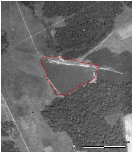
Tagebau Polenz, Notkohlenbetrieb (Kartengrundlage: Landesamt für Archäologie Sachsen: Luftbilder 1950er Jahre. 2021.)