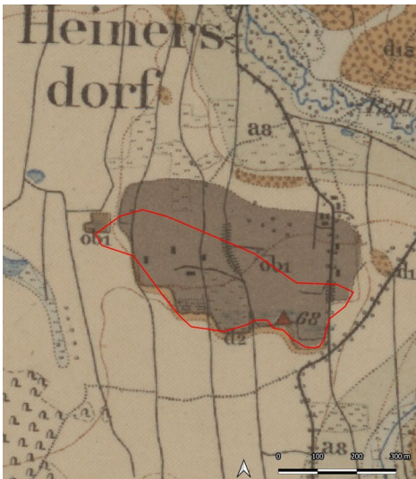
Braunkohlegruben Heinersdorf bei Bad Lausick (Kartengrundlage: Sächsische Landesbibliothek - Staats- und Universitätsbibliothek / Deutsche Fotothek: Geologische Karte von Sachsen (Königreich), Sektion 43: Lausigk und Borna, 1902.) Fotograf/Urheber: Ullrich Ochs