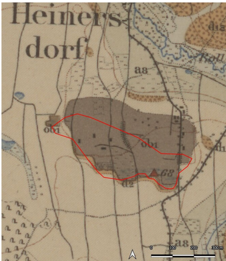
Braunkohlegruben Heinersdorf bei Bad Lausick (Kartengrundlage: Sächsische Landesbibliothek - Staats- und Universitätsbibliothek / Deutsche Fotothek: Geologische Karte von Sachsen (Königreich), Sektion 43: Lausigk und Borna, 1902.) Fotograf/Urheber: Ullrich Ochs