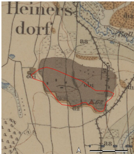
Braunkohlegruben Heinersdorf bei Bad Lausick (Kartengrundlage: Sächsische Landesbibliothek - Staats- und Universitätsbibliothek / Deutsche Fotothek: Geologische Karte von Sachsen (Königreich), Sektion 43: Lausigk und Borna, 1902.) Fotograf/Urheber: Ullrich Ochs