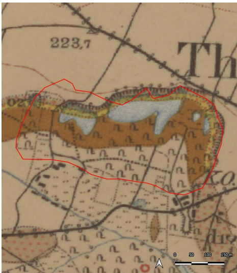
Grube Lange, ab 1860 Pönisch, ab 1872 Craul (Kartengrundlage: Sächsische Landesbibliothek - Staats- und Universitätsbibliothek / Deutsche Fotothek: Geologische Karte von Sachsen (Königreich), Sektion 44: Colditz und Großbothen, 1900.) Fotograf/Urheber: Ullrich Ochs