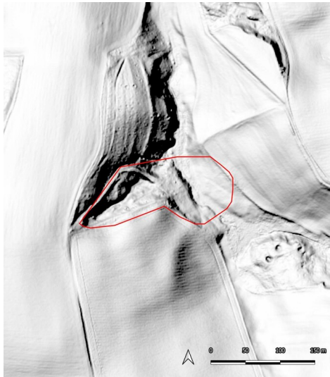
Braunkohlenwerk des Pfarrlehns Döben, Grechwitz, (Kartengrundlage: GeoSN, dl-de/by-2-0.: DGM1 Sachsen. 2023.)