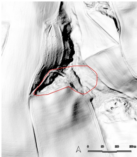
Braunkohlenwerk des Pfarrlehns Döben, Grechwitz, (Kartengrundlage: GeoSN, dl-de/by-2-0.: DGM1 Sachsen. 2023.) Fotograf/Urheber: Ullrich Ochs