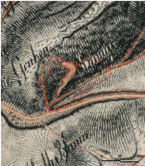
Die Gruben, Grechwitz, (Kartengrundlage: Sächsische Landesbibliothek - Staats- und Universitätsbibliothek / Deutsche Fotothek: Meilenblätter von Sachsen, Berliner Exemplar, Blatt 79: Grimma, Großbardau, Großbothen, Kaditzsch, 1803.)