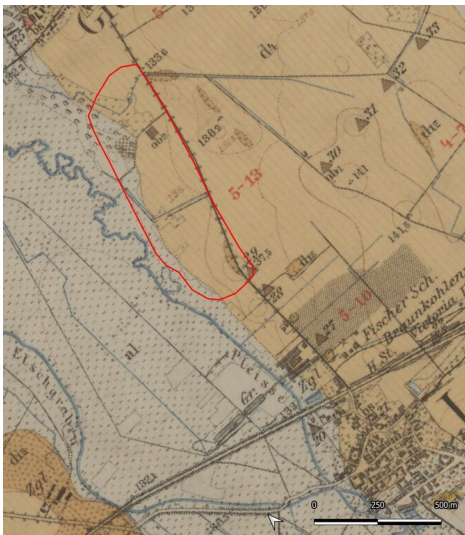
Brikettfabrik Dora & Helene I und II um 1903 (Kartengrundlage: Sächsische Landesbibliothek - Staats- und Universitätsbibliothek / Deutsche Fotothek: Geologische Karte von Sachsen (Königreich), Sektion 42: Borna und Lobstädt, 1903.)

Schlagwörter: Brikettfabrik Fachsicht(en): Denkmalpflege Gemeinde(n): Neukieritzsch Kreis(e): Leipzig Bundesland: Sachsen