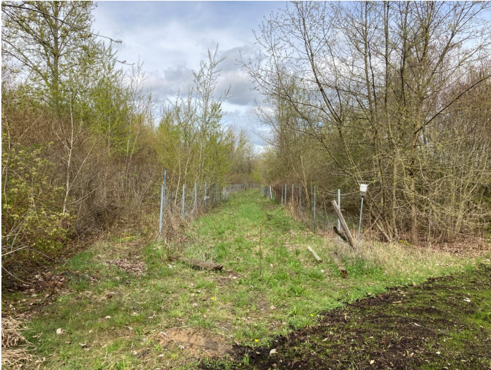
Überreste einer Kohlenbahnstrecke westlich von Neukieritzsch