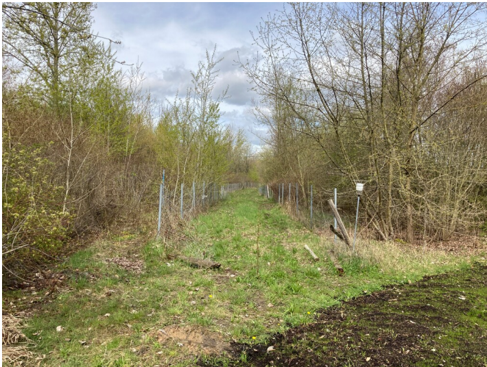
Überreste einer Kohlenbahnstrecke westlich von Neukieritzsch