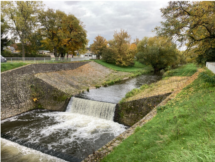
Die Gefällestufe der Pleiße in Deutzen, Blick in Richtung Süden