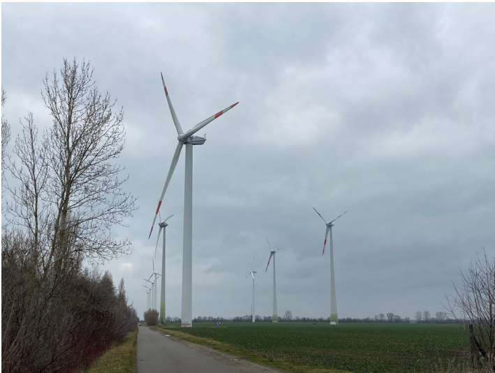
Windkraftwerk auf dem Gelände des ehemaligen Abbaufelds Profen, Blick in Richtung Norden

Schlagwörter: Windkraftwerk Fachsicht(en): Denkmalpflege Gemeinde(n): Pegau Kreis(e): Leipzig Bundesland: Sachsen