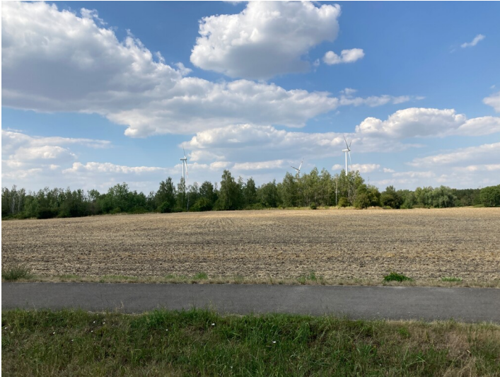
Drei Windkraftwerke auf ehemaligem Tagebaugelände, Blick von Süden