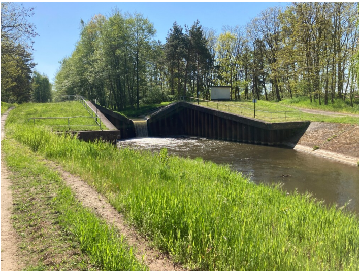
Wasserbauliche Anlage zur Regulierung des Abflussverhaltens, Blick flussaufwärts