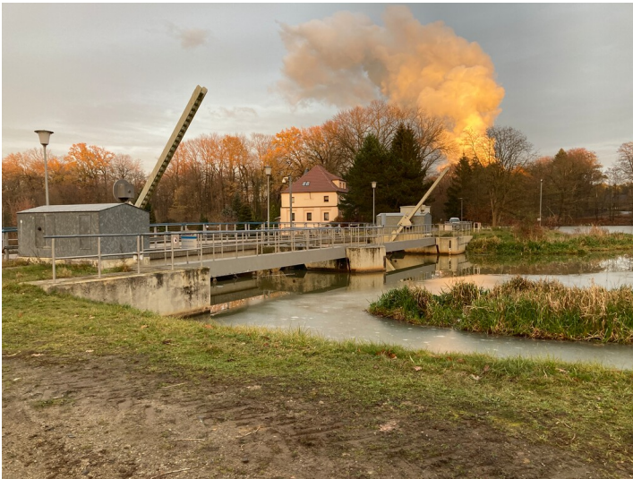
Wehranlage im Flusslauf der Spree