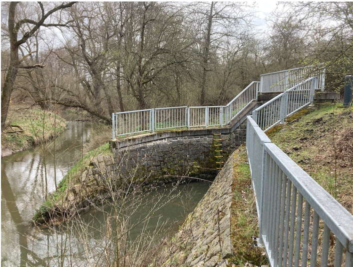
Auslaufbauwerk Speicher Lobstädt mit untertägigem Durchlass, Blick in Richtung Süden