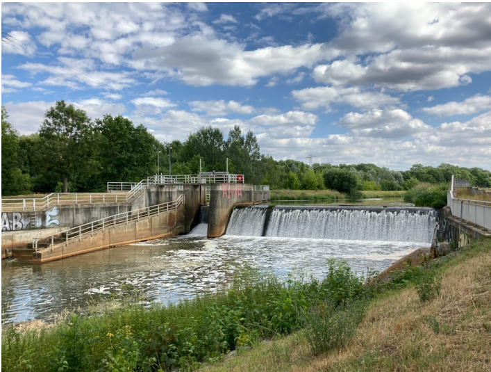
Agra-Wehr zur Regulierung des Abflussverhaltens der Pleiße, Blick von Nordwest.