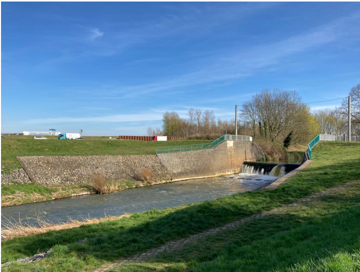
Wehranlage in der Pleiße, Blick flussaufwärts