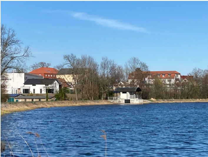
Auslaufbauwerk seeseitig mit Blick nach Norden