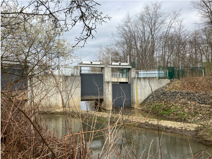
Zulauf Speicherbecken Witznitz, Blick in Richtung Norden