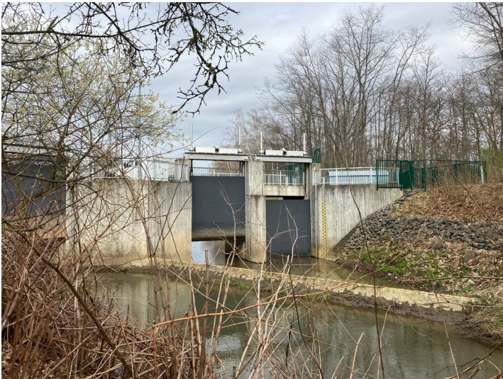
Zulauf Speicherbecken Witznitz, Blick in Richtung Norden