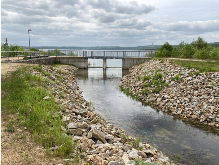
Auslaufbauwerk Berzdorfer See, Blick in Richtung See