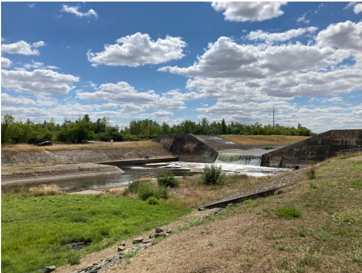
Blick flussaufwärts auf die Staustufe