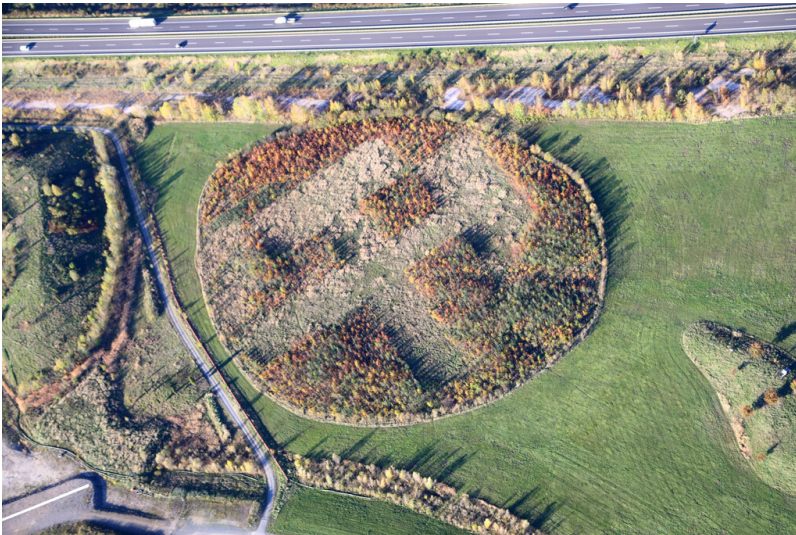
Waldstück in Form von Schlägel und Eisen, gelegen an der A38 zwischen Cospudener See und Zwenkauer See