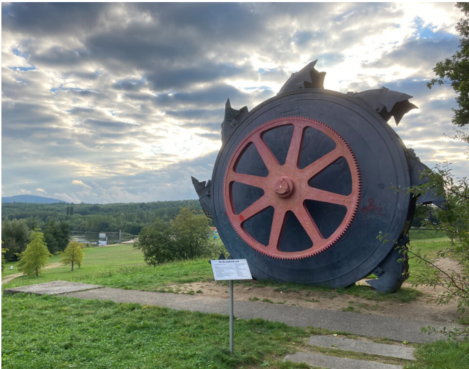
Blick auf das Schaufelrad mit dem Olbersdorfer See im Hintergrund