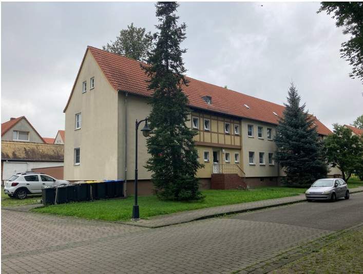
Bergarbeitersiedlung Kitzscher, Mehrfamilienwohnhäuser an der Parkstraße, Blick nach Nordost