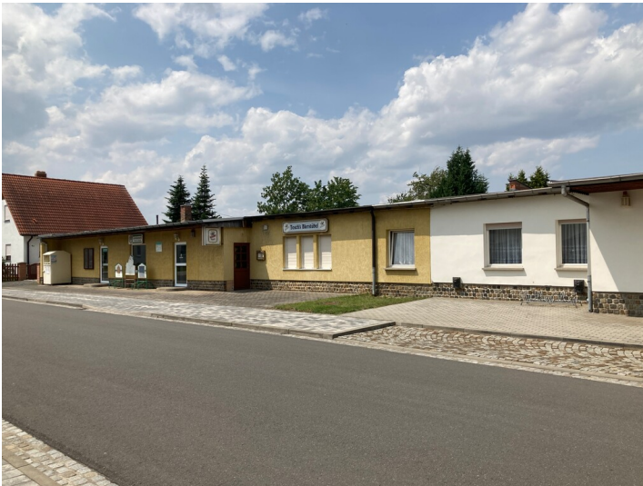
Das ehemalige Behelfsheim wird heute gewerblich genutzt, Blick von Südosten