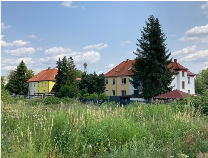
Zwei Wohnhäuser von der ursprünglichen Straßenseite, Blick von Südwesten, im Hintergrund die Wasserkugel Deutzen