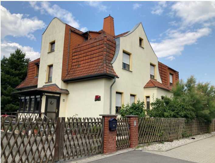
Wohnhaus Nr. 4 in der heutigen Straße An der Adria, Blick von Südwesten