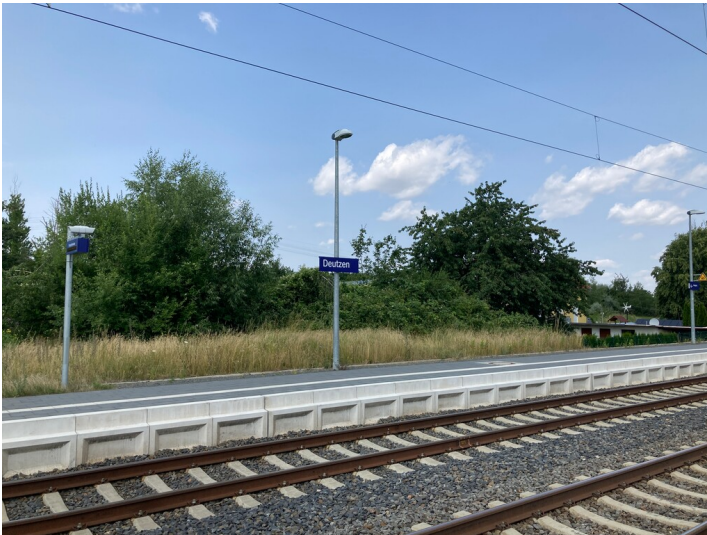
Der sanierte und modernisierte Haltepunkt Deutzen an der Bahnlinie Hof-Leipzig, Blick von Osten