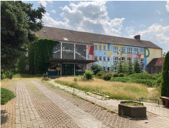
Blick aus Norden auf die Schule mit dem Haupteingang