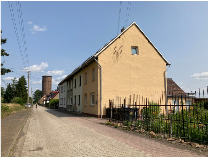
Siedlung, Blick aus Süden, vorn eine Reihenhaushgruppe, dahinter Doppelhäuser, im Hintergrund der Wasserturm