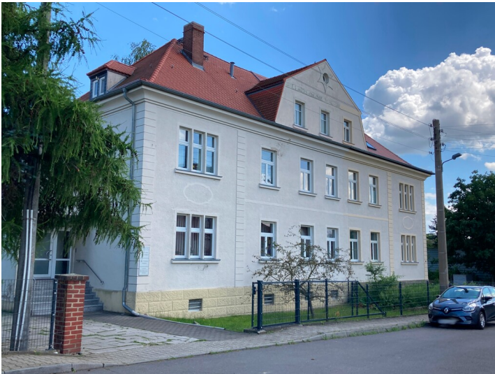
Mehrfamilienwohnhaus, Blick von Nordwesten