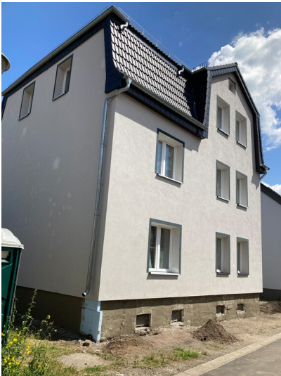
Wohnhaus, Blick von Südwesten