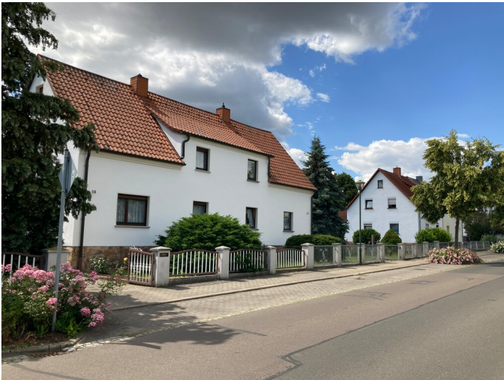
Zwei Doppelwohnhäuser, Blick von Südosten, vorn Nr. 14