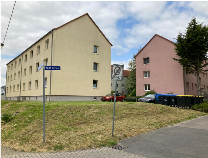
Drei Mehrfamilienwohnhäuser, gelb zur Alt-Witznitzer-Straße von 1958, rosa zur Neuen Straße von 1960