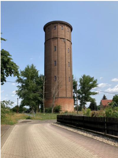
Wasserturm, Blick von Süden aus der Siedlung