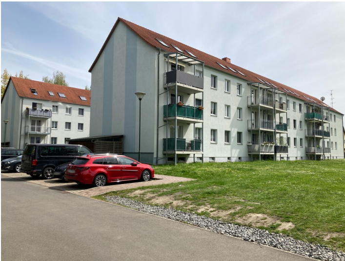
Rückseite der beiden Wohnblöcke, Blick von Nordwesten