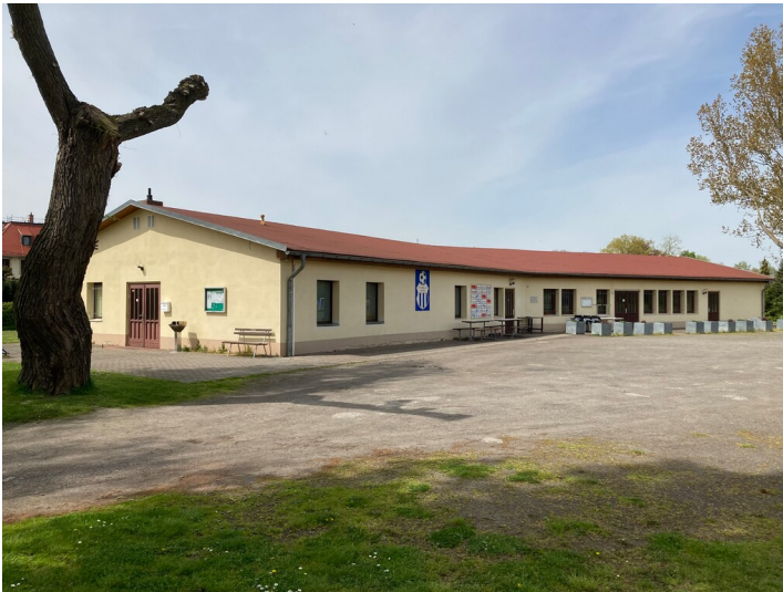
Sportlerheim, Blick von Südosten