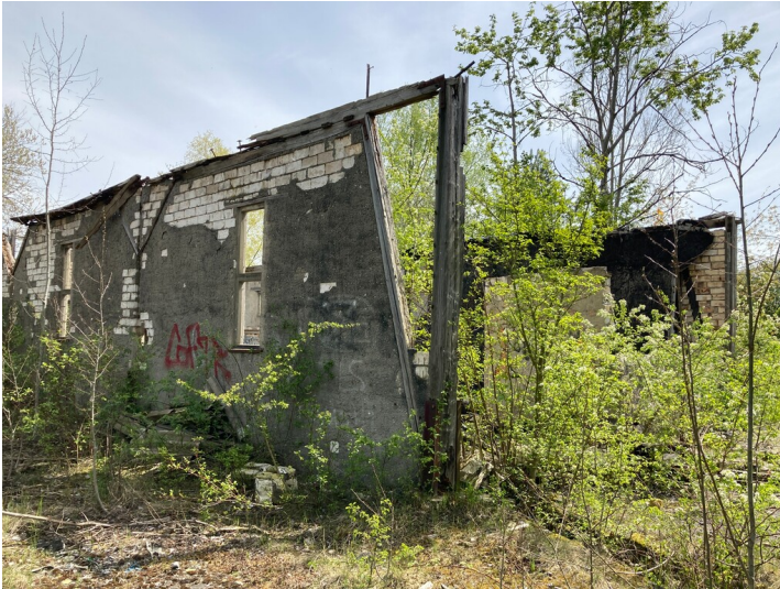
Industriebrache mit einem beispielhaften Gebäuderest