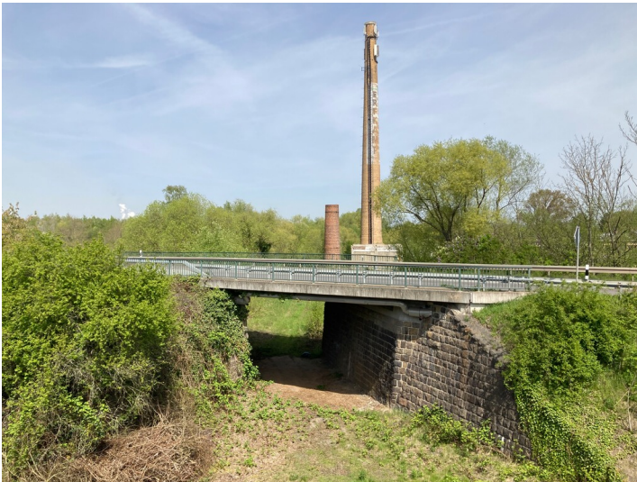
Straßennbrücke der B 176 über die einstige Werkbahn, im Hintergrund die ehemalige Ziegelei Lobstädt, fotografiert von der Brücke Bahnberg