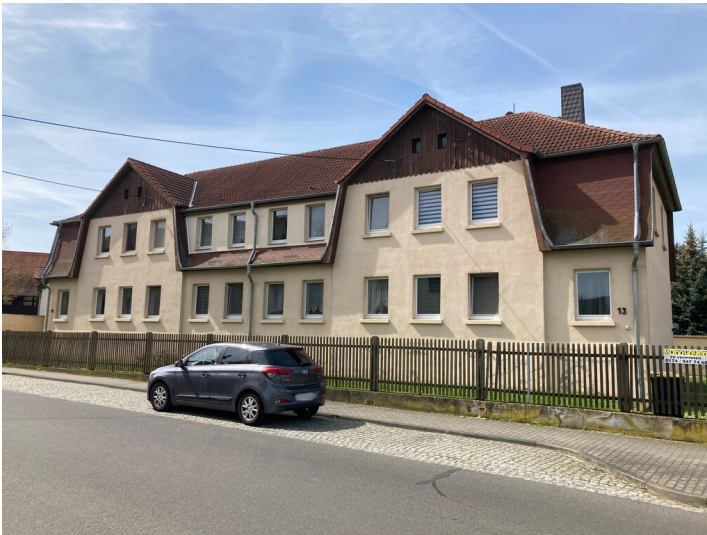
Einstiges Bergarbeiterwohnhaus in zentraler Lage in Lobstädt