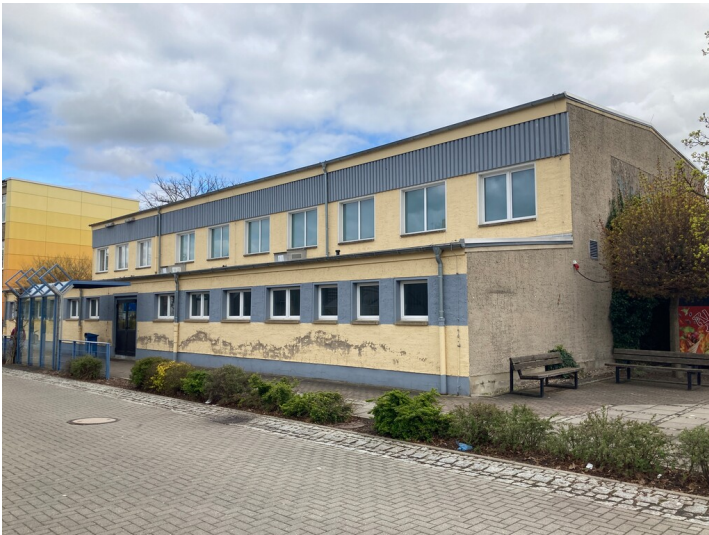
Turnhalle der Siedlung Neukieritzsch-Nord, Blick von Westen, rechts die Giebelseite zur Leipziger Straße mit dem Wandbild