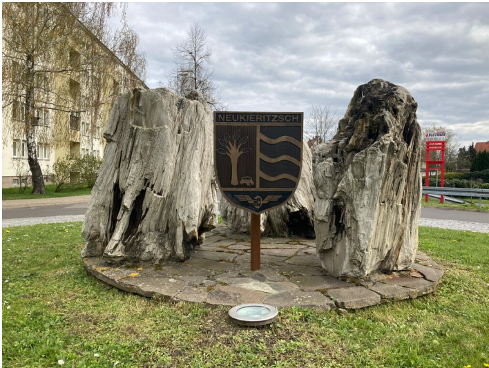
Ortseingangsgestaltung mit Gemeindewappen und drei versteinerten Baumresten, Blick von Norden