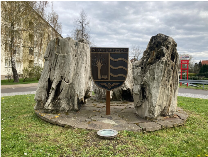
Ortseingangsgestaltung mit Gemeindewappen und drei versteinerten Baumresten, Blick von Norden