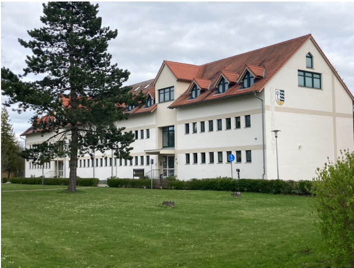
Das ehemalige Kindergartengebäude als Teil der Siedlung Neukieritzsch-Nord, Blick von Westen