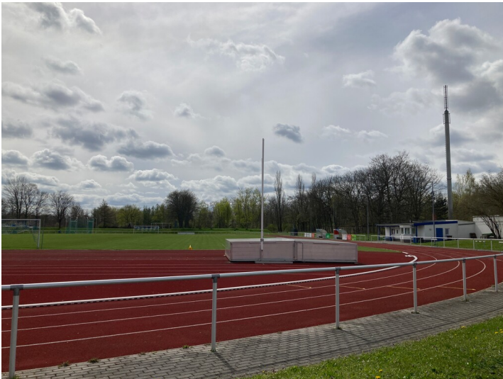
Nördlicher Sportplatz mit Laufbahn, daneben Nebengebäude, Blick von Norden