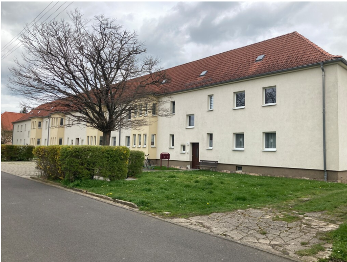
Wohnhaus, Blick von Südwesten