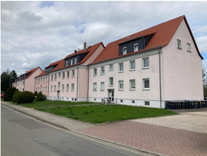
Fünf Mehrfamilienwohnhäuser, Blick von Südwesten