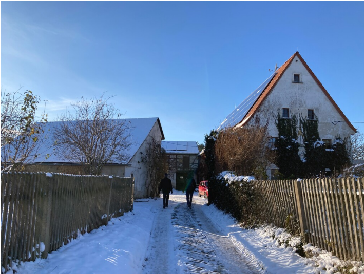
Einst Sitz des Kohlenwerkes Kirbach, rechts das Wohnstallhaus mit steilem Satteldach, Blick vom Anger aus Osten