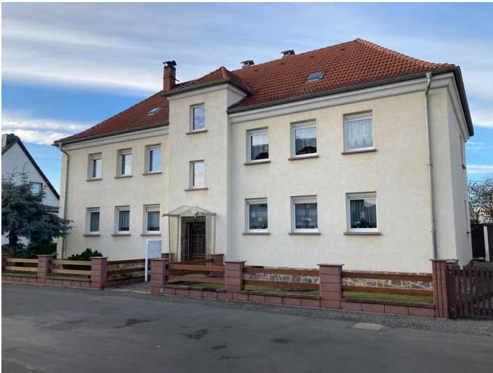
Mehrfamilienwohnhaus der Bergmanns-Wohnstättengesellschaft, Blick von Osten