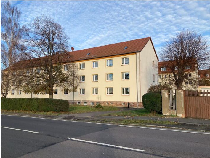
Straßenseitiger Wohnblock, im Hintergrund die benachbarten beiden, Blick von Südwesten