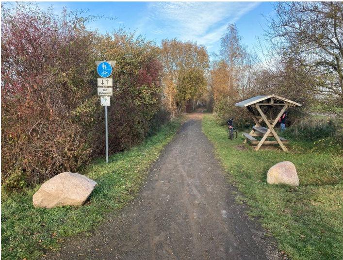
Erhaltener Bahndamm der einstigen Kohleverbindungsbahn zwischen Tagebau Neukirchen und Brikettfabrik Neukirchen bzw. Tagebau Borna-Ost. Als Radweg umgenutzter Abschnitt am Blumrodaer Weg, Blick nach Nordosten